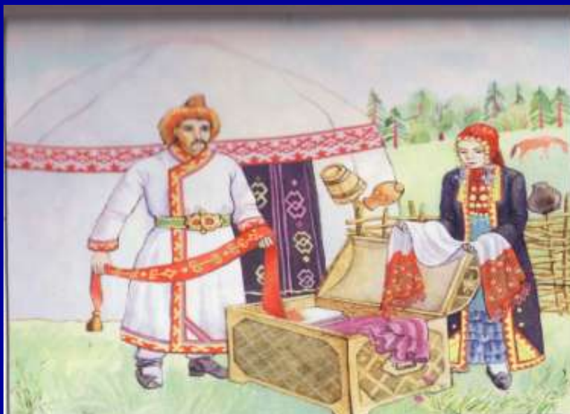
Юрта – башкирский дом