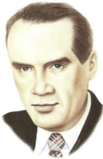
Носов Николай Николаевич (1908-1976)