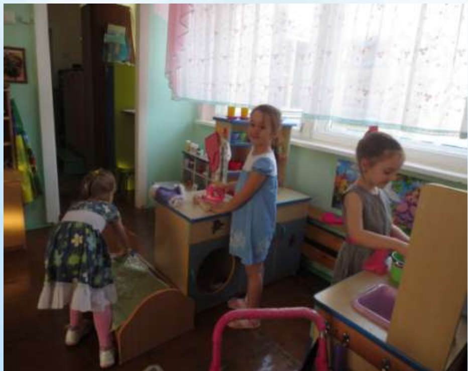
Сюжетно-ролевая игра «Дом»

Центр игры: включает материалы и атрибуты для сюжетно-ролевых, настольно-печатных, театрально-художественных, строительно-конструктивных дидактических, спортивных, подвижных игр. Сюжетно – ролевые игры: «Больница», «Супермаркет», «Дом», «Салон красоты».