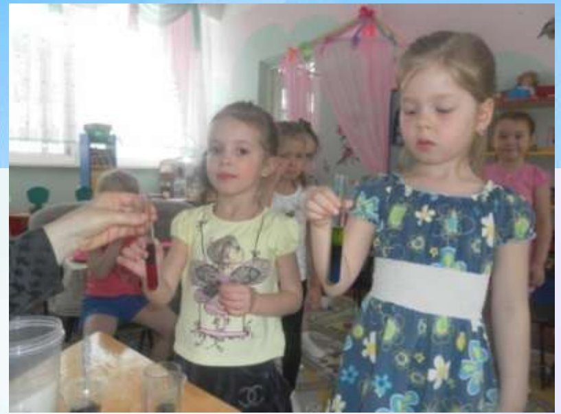
Опыты: «Определение плотности воды»