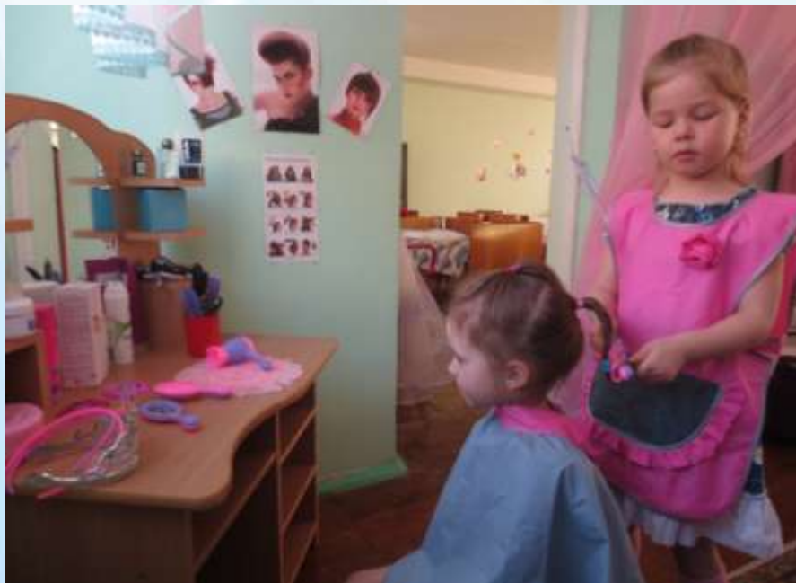
Сюжетно-ролевая игра «Салон красоты»