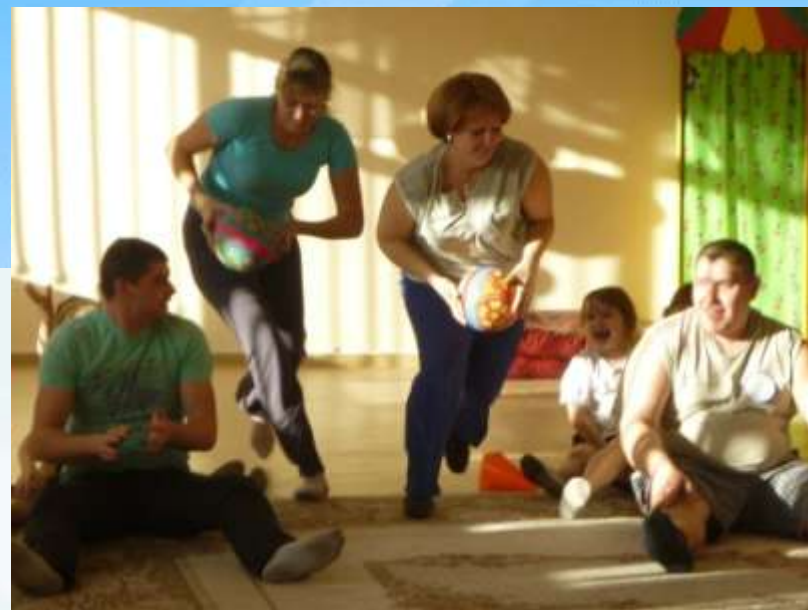
«Мама, папа, я – спортивная семья»