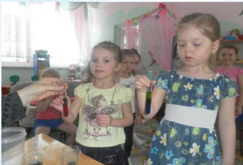
Эксперименты с водой

В процессе познавательно-исследовательской деятельности происходит формирование ребенка как самостоятельного и инициативного субъекта деятельности и познания