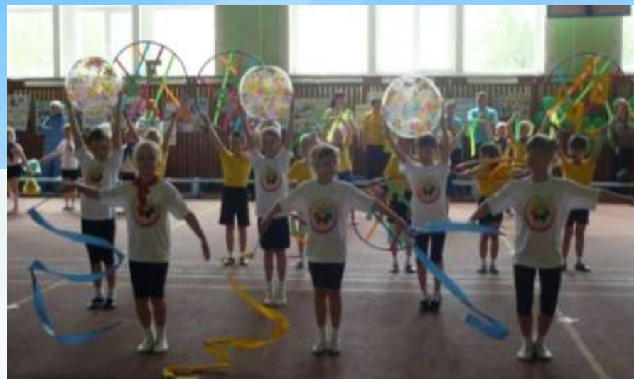
Участие в городских фестивалях детского творчества «Малая Березиада» «Умники и умницы»