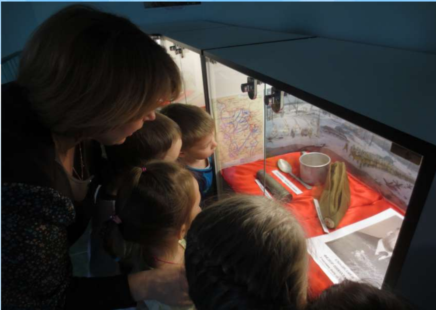
Экскурсия в музей воинской доблести и славы