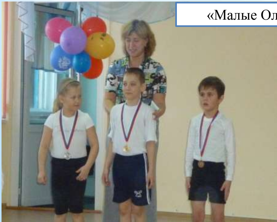
«Малые Олимпийские игры»