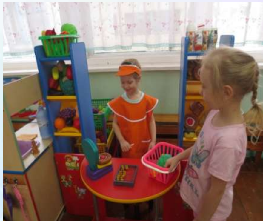
Сюжетно-ролевая игра «Магазин»