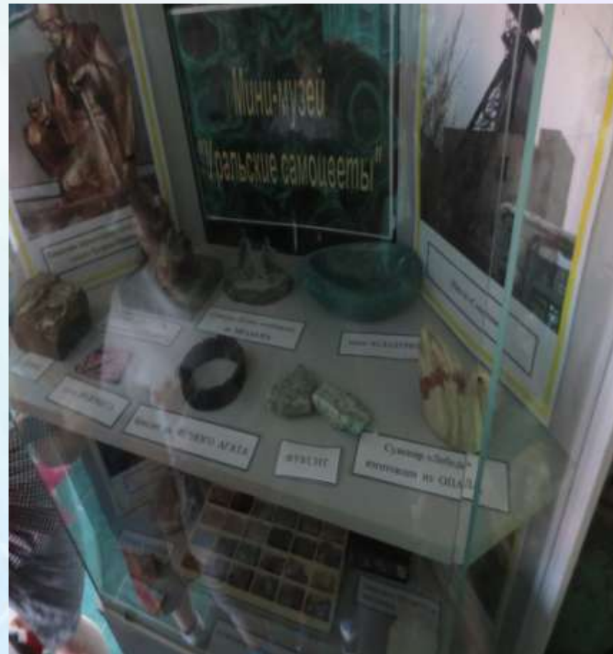
Экскурсия в музей Уральского камня