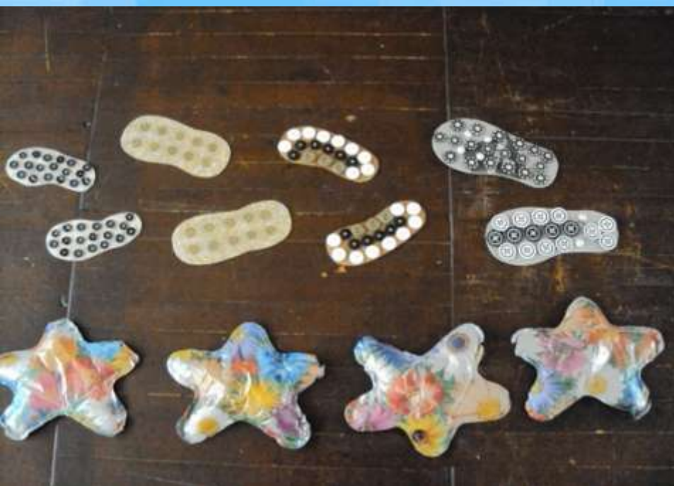
Оборудование физкультурного уголка