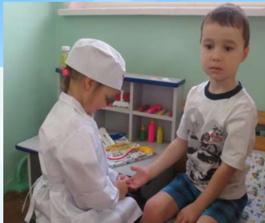
Сюжетно-ролевая игра «Больница»

Игра - это школа социальных отношений, в которых моделируются формы социального поведения ребенка.