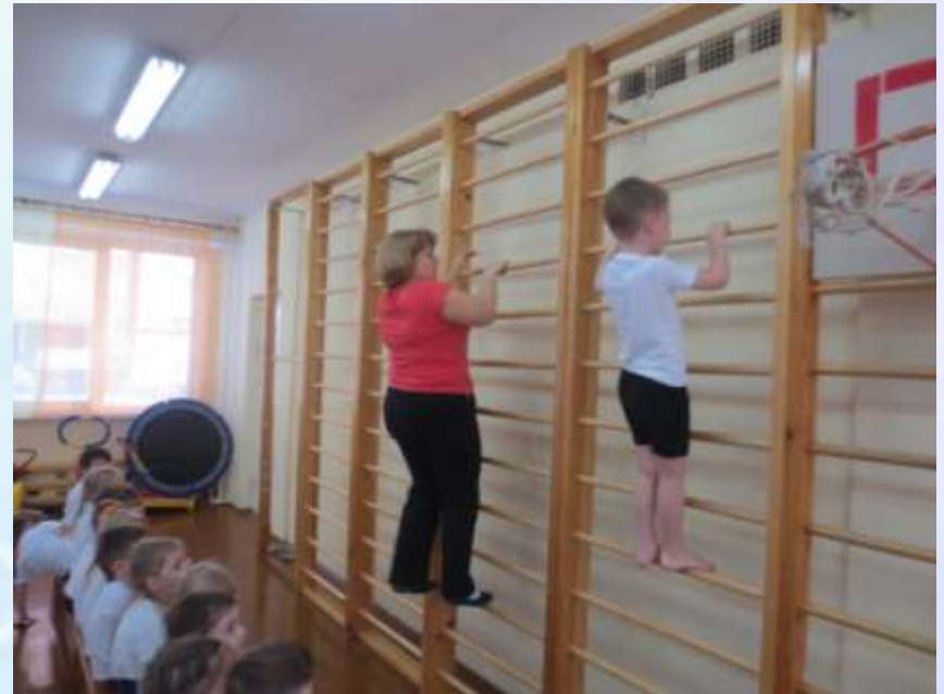
ГТО под силу дошколятам