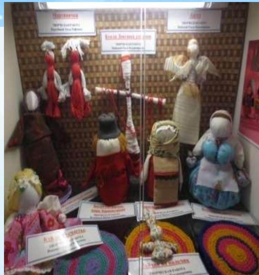
Экскурсия в музей народной игрушки