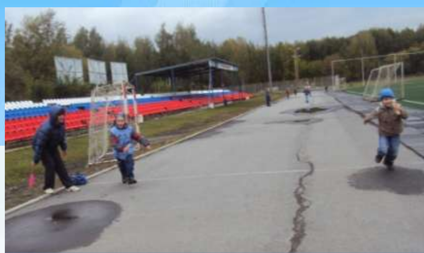
Дополнительный час игры для сдачи норм ГТО