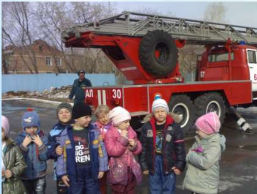
Экскурсия в пожарную часть