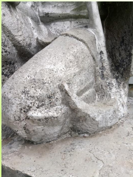
Фрагмент памятника Ерофею Маркову

Обязательно! Держите в руках флажок с номером команды. Отправьте фото куратору через приложение WhatsApp .