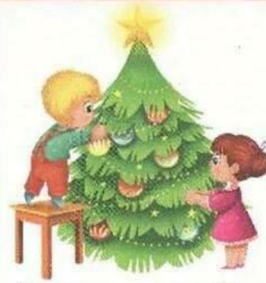
Дети нарядили ёлку