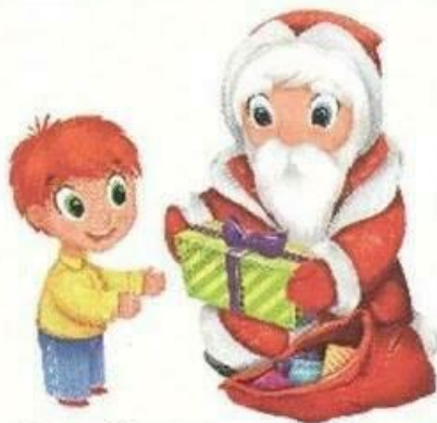
Дед Мороз принёс подарки