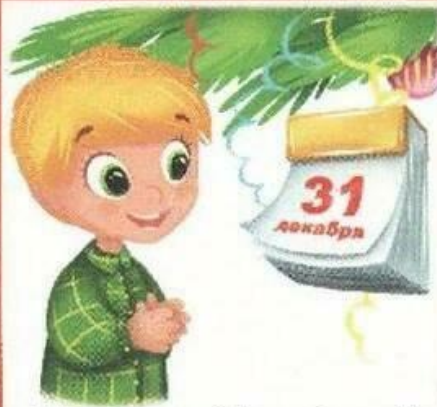
Наступил Новый год!