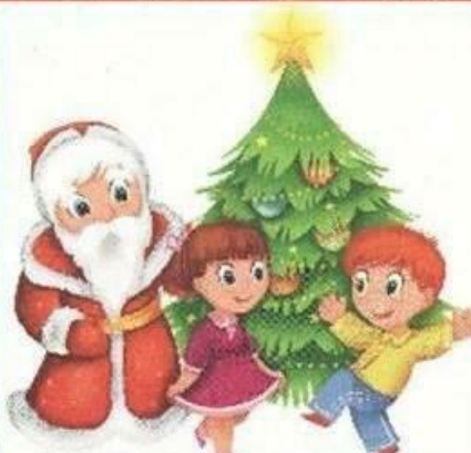
Дети танцуют и поют