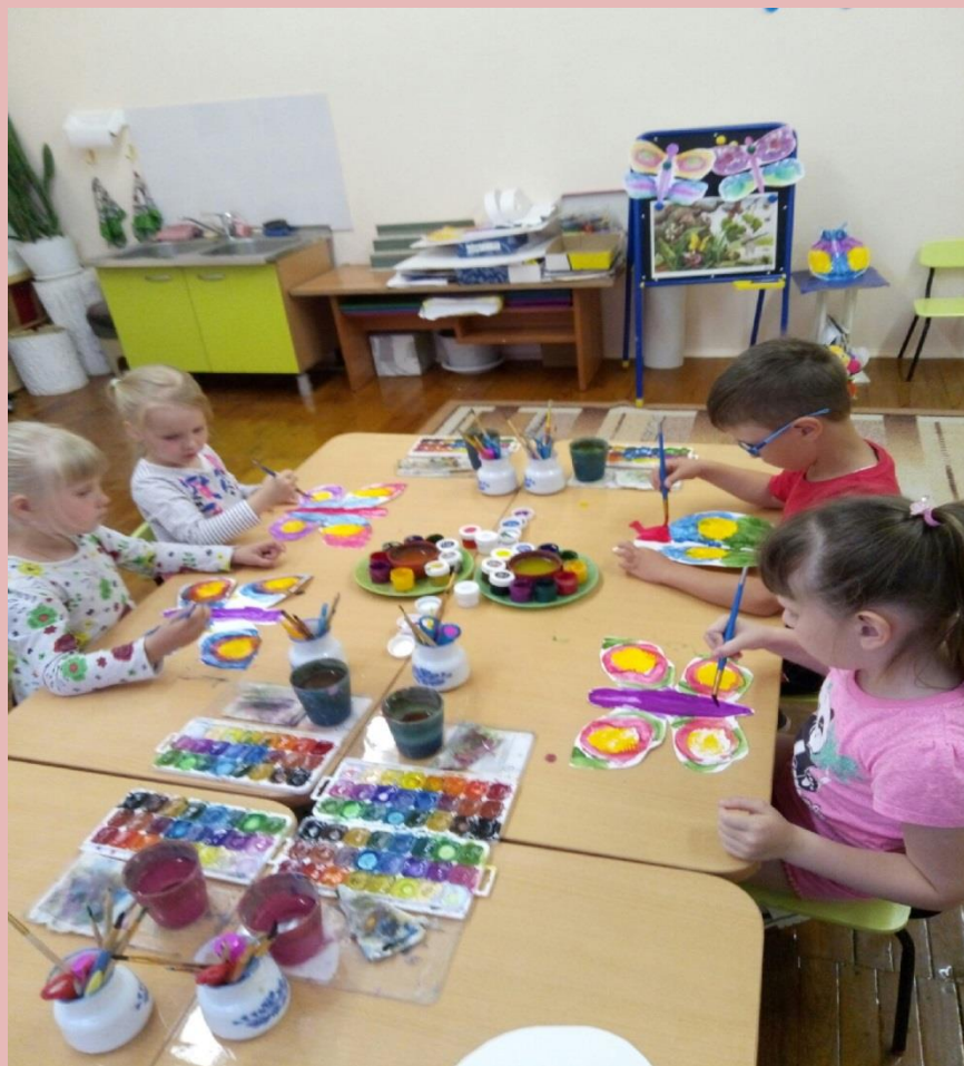
Украшаем крылья бабочек и жуков способом печати (монотипия по сгибу)