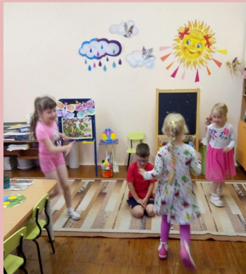
Играем в музыкальную игру: «Бабочки и жуки»