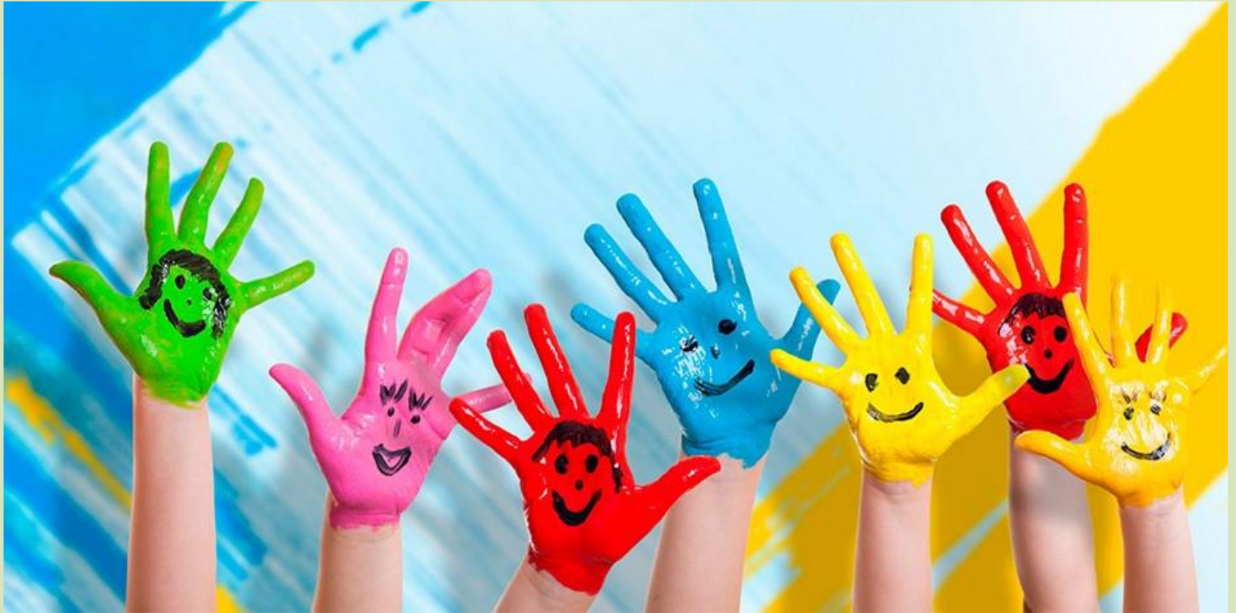
Фото с занятий в старшей группе № 6 БМАДОУ №41 2021 г