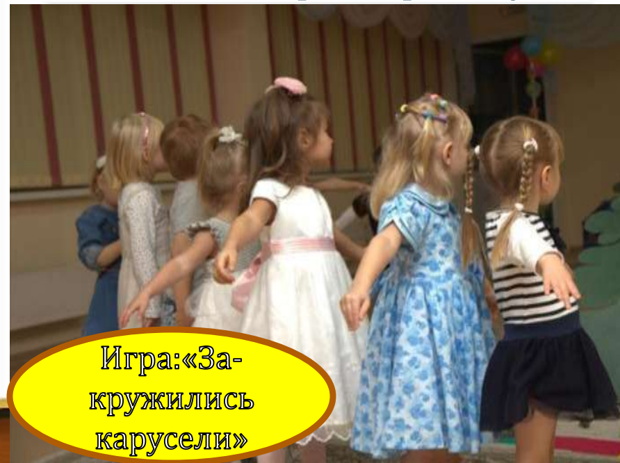
Игра: «За- кружились карусели»