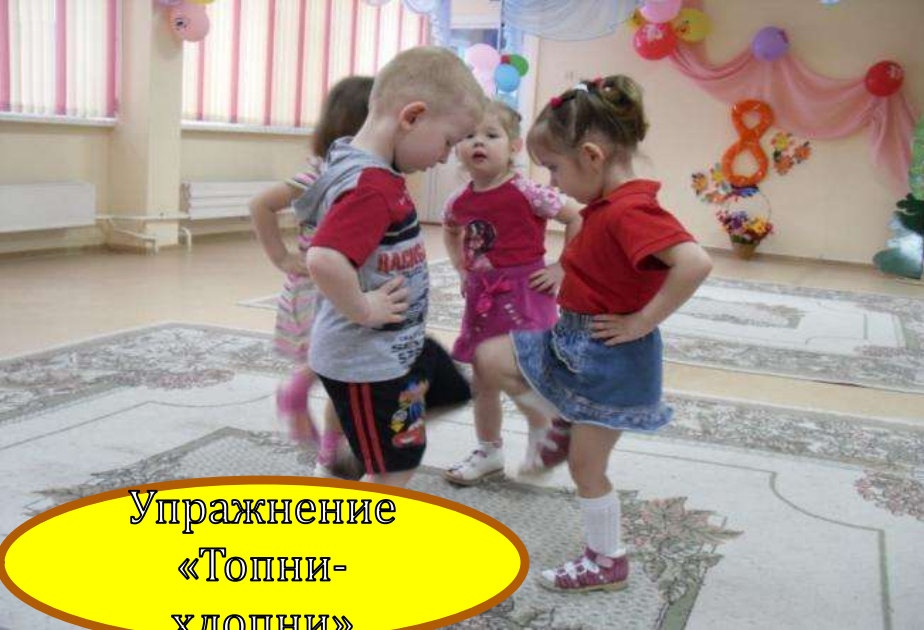
Упражнение «Топни- хлопни»