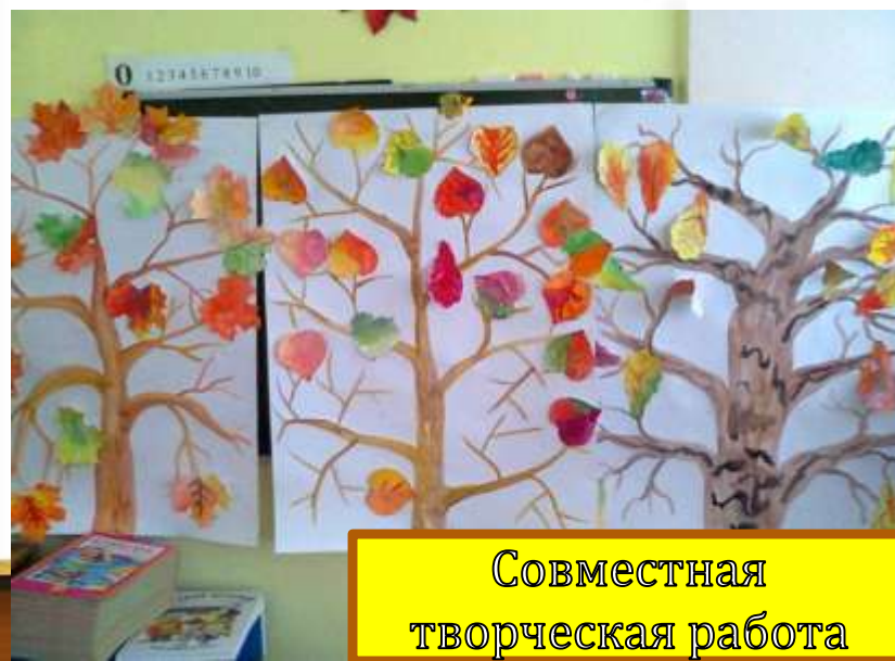
Совместная творческая работа