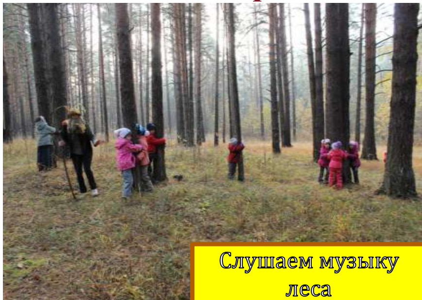
Слушаем музыку леса