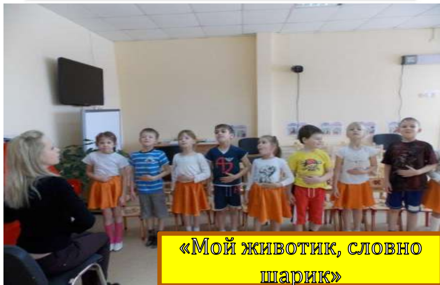
«Мой животик, словно шарик»