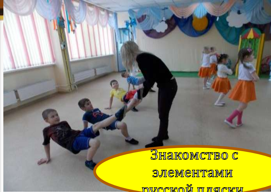
Знакомство с элементами русской пляски

Развитие музыкально-ритмических движений через формирование умения ритмично двигаться в соответствии с характером музыки