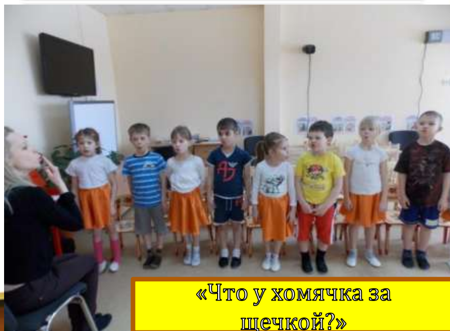
«Что у хомячка за щечкой?»