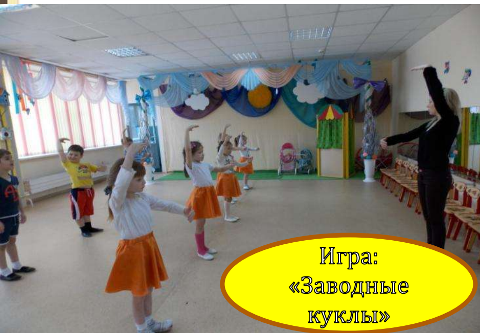
Игра: «Заводные куклы»

Развитие музыкально-ритмических движений через формирование умения ритмично двигаться в соответствии с характером музыки