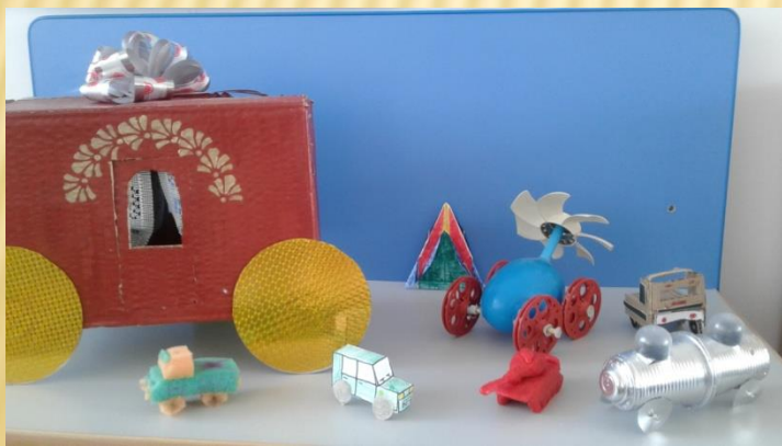
Выставка детско- родительских поделок «Транспорт» (часть)