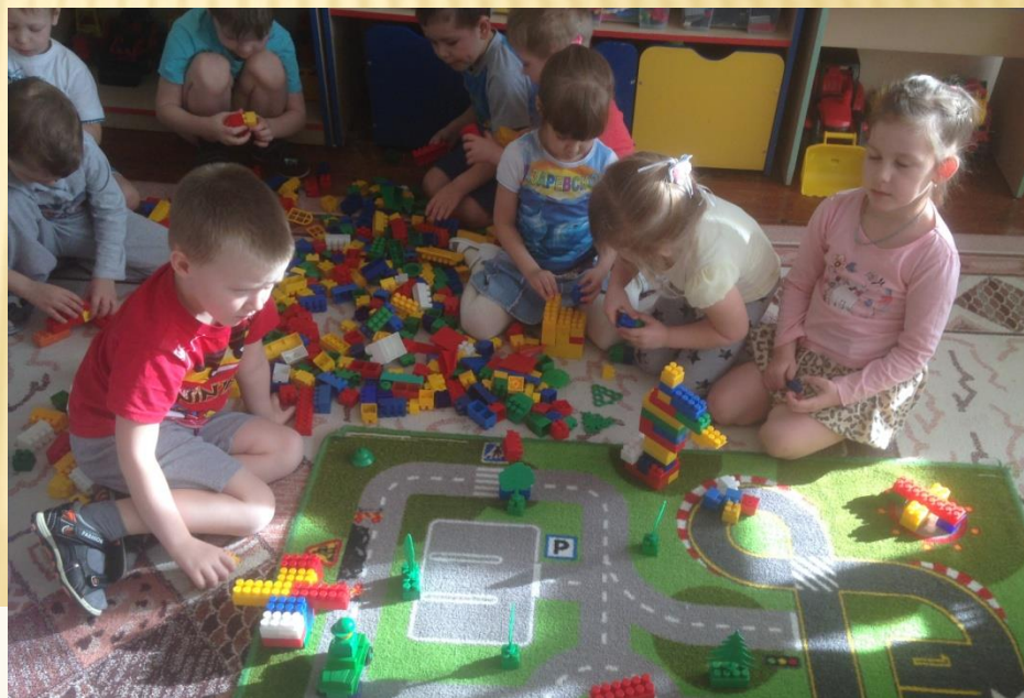
Работа по карточкам