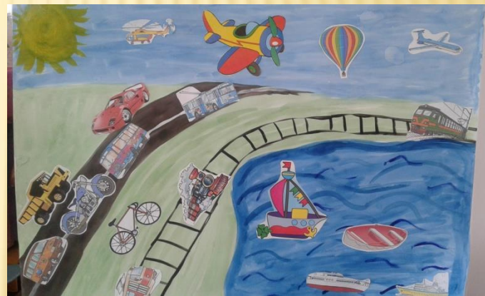
Коллаж «Виды транспорта»