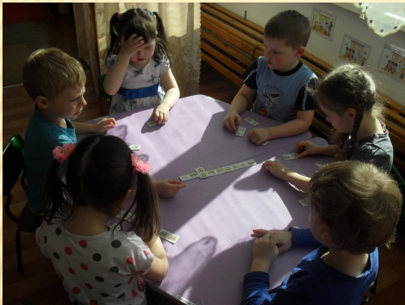
Настольно-печатная дидактическая игра